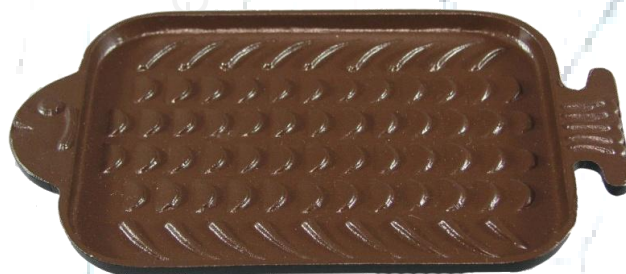
サイズ: 205×125×12mm 重量 240g