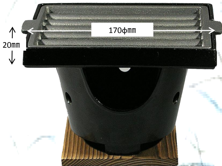
サイズ: 170×135×20mm 重量500g

二段式方法により焼き汁が落ちにくい設計です 間接熱により柔らかく焼き上がります 焼き網はフッ素仕上げで、くっつきにくい仕様です 朝食の焼き物料理に等しいかがでしょうか