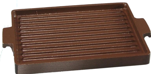
サイズ: 208×142×16mm 重量 310g フッ素仕上げ